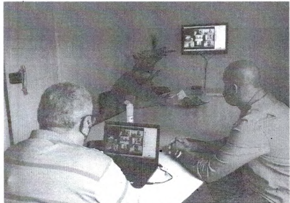
Em reunião, foi reforçada a possibilidade do Estadual retornar no mês de novembro