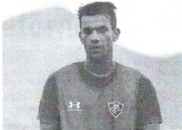
O jogador é aguardado nos próximos dias em Belo Horizonte